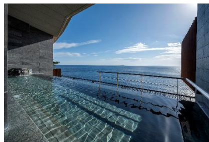
スパリウムニシキ