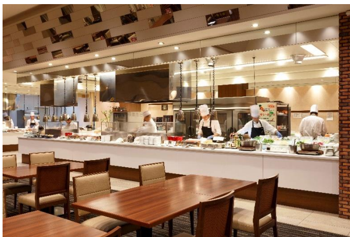
グリルビュッフェ

窓外に広がるオーシャンビューで開放感のある空間。アイランド型のグリルカウンターや富士の溶岩石を使った石窯を備え、オープンキッチンではライブクッキングを提供する和洋中ビュッフェ。