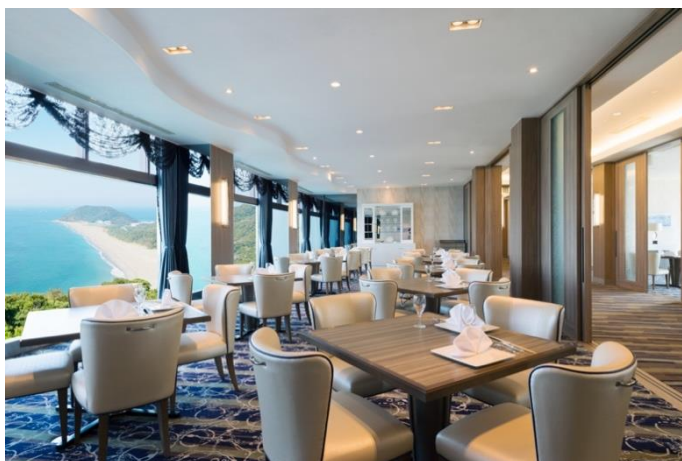
メインダイニング