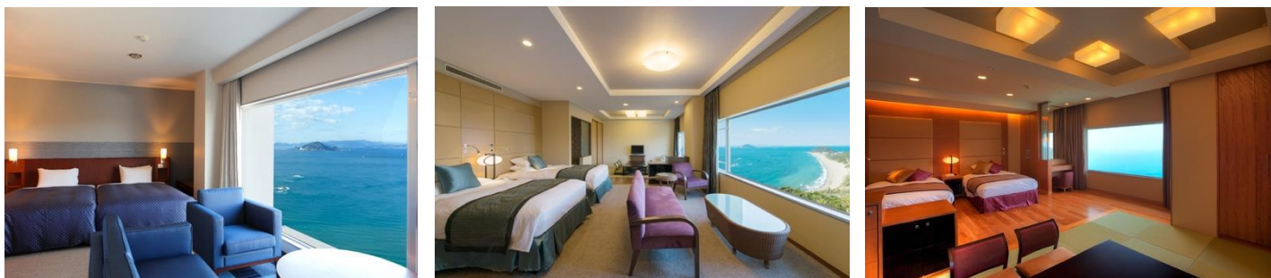
画像左から：スーペリアワイドビューフォース、デラックス和洋室、和洋室

デラックス：ツイン (29~33㎡) ・ワイドビューツイン (46㎡) ・和洋室 A (44㎡) ・和洋室 B (51~58㎡) ・和洋室 C (62~68㎡)