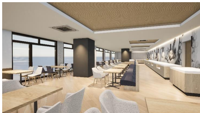
2階 ビュッフェスタイルのレストラン

近海の地魚を含め、新鮮な海の幸を使った各種メニューをビュッフェスタイルでご利用いただけます。ライブコーナーではシェフがその場で仕上げる各種お料理をご用意いたします。