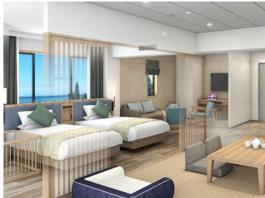
画像左から：洋室トリプル、和洋室ペットルーム