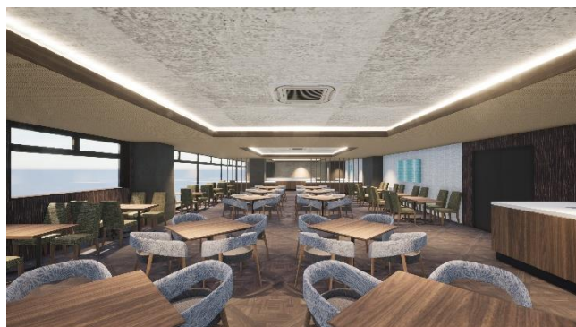
3階 コース料理提供のレストラン

地元静岡の漁港に水揚げされた新鮮な魚介類をふんだんに使用した全8品のコース料理をご用意。ブイヤベースのほか金目鯛とポーク、または“あしたか牛”を玉葱フォンデュで味わう3つのメイン料理からお選びいただけます。料理に合わせたワインでフードペアリングなど、海を見ながらゆったりとお食事をお楽しみいただけます。