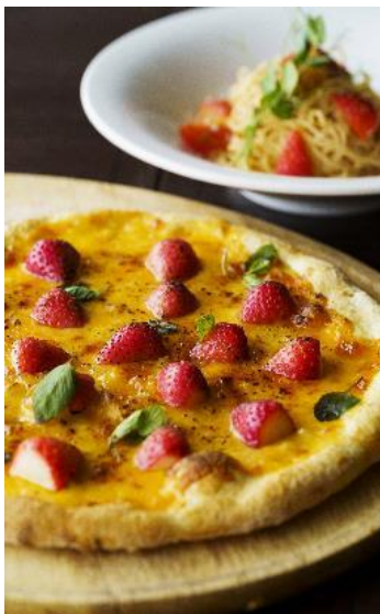
イチゴと3種チーズの手作りピザ