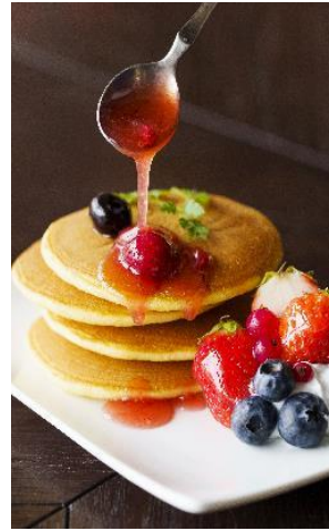
イチゴのパンケーキ