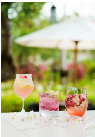
「桜」をテーマとした3月のカクテル3種 左から「春の息吹」「しま桜」「桜スプモーニ」

詳細： https://www.fusaki.com/blog/archives/13931