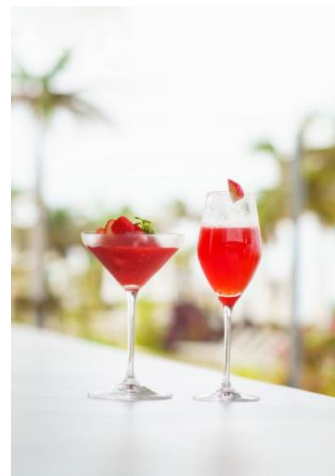
「苺」をテーマとした4月からのカクテル2種 左から「贅熟ストロベリーミモザ」「ストロベリーダイキリ」