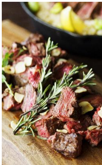
ガーリックサイコロステーキ