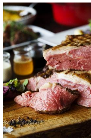
ローストビーフと春野菜のベニエ